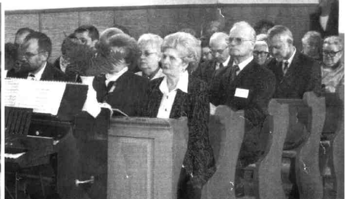
A nemzetközi konferencia vendégei